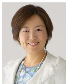
コーディネーター